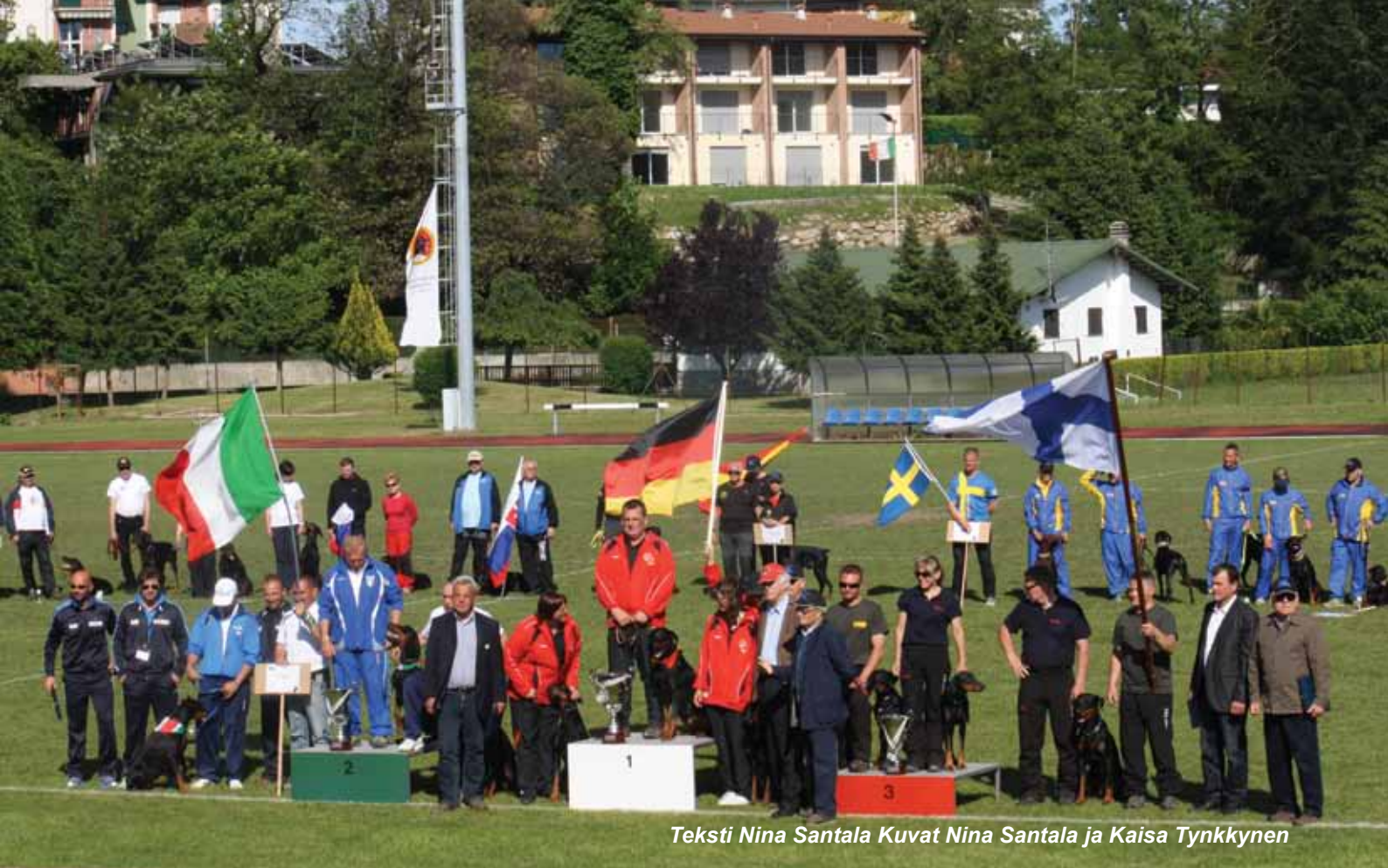
Teksti Nina Santala